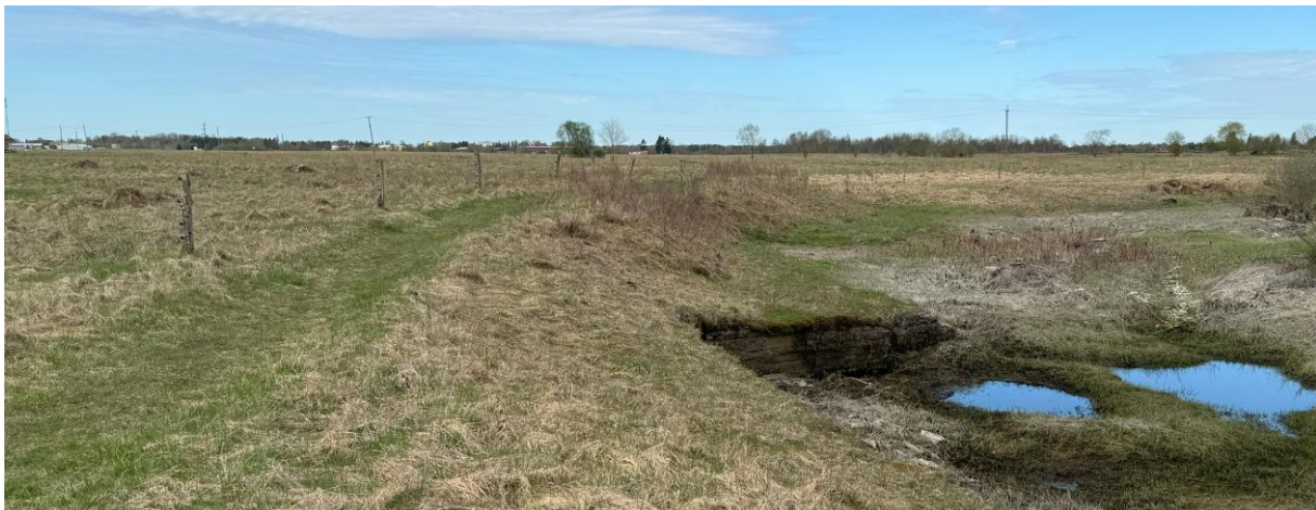
Foto 2. Kariloomade piirdeaed, õpperada ning jõesäng.

Rada kulgeb mööda heinamaad, mille ühele küljele jääb kariloomadele ettenähtud piirdeaed, teisele poole Jõelähtme jõgi.